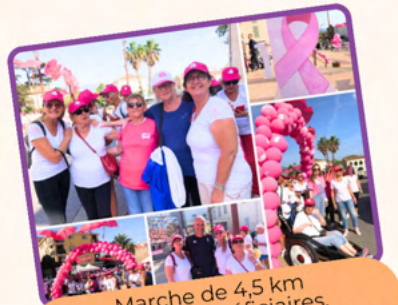
Marche de 4,5 km avec les bénéficiaires, organisée par la Ville de Fréjus