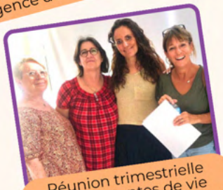
Réunion trimestrielle des assistantes de vie