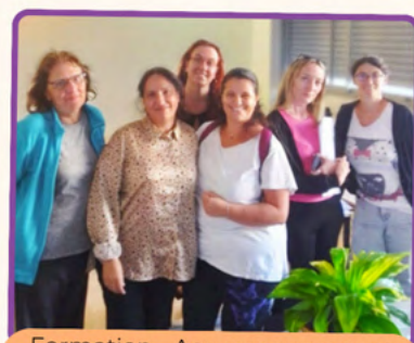
Formation - Accompagnement des personnes en fin de vie