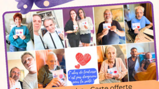
Câlin de poche - Carte offerte par le CCAS de Toulon