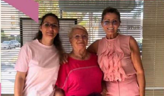
Les agences de Menton et Fréjus investies pour OCTOBRE ROSE