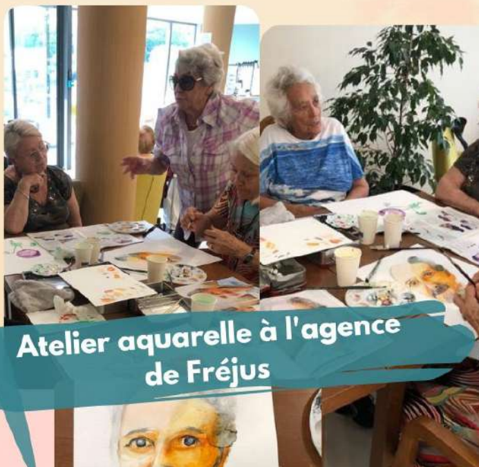
Atelier aquarelle à l'agence de Fréjus