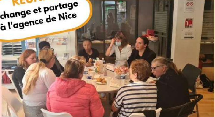
REUNION Echange et partage à l'agence de Nice